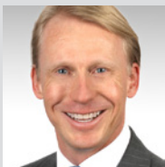
Marc Lussy objtec. GmbH Wädenswil